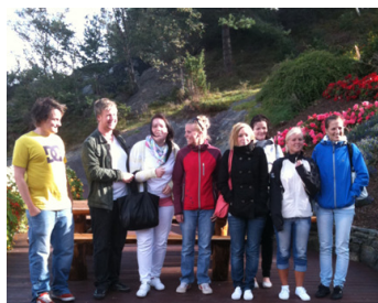
Млади участници в ТАНДЕМ, Ставангер (Норвегия).

„Интересувам се от различните култури и с това интервю разбрах неща, които не могат да се открият в Интернет.“