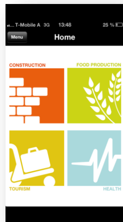
Screenshot of the REACH app in use on a mobile phone.

REACH è un progetto che coinvolge 6 paesi EU: Austria e UK con i contenuti originali per la formazione via cellulare o Mobile – learning; Norvegia, Spagna, Italia e Turchia come paesi target che adattano questi contenuti a fabbisogni formativi di competenze base nei settori delle costruzioni, della produzione alimentare, del turismo e della salute e benessere. È stata elaborata una nuova piattaforma tecnologica dai paesi mandanti che hanno offerto un nuovo accesso al materiale didattico REACH e la App sui maggiori App – Stores per dispositivi Android e iPad/Phones.